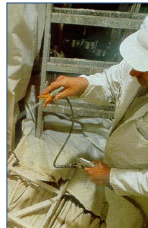
Protección de túneles y galerías de cables